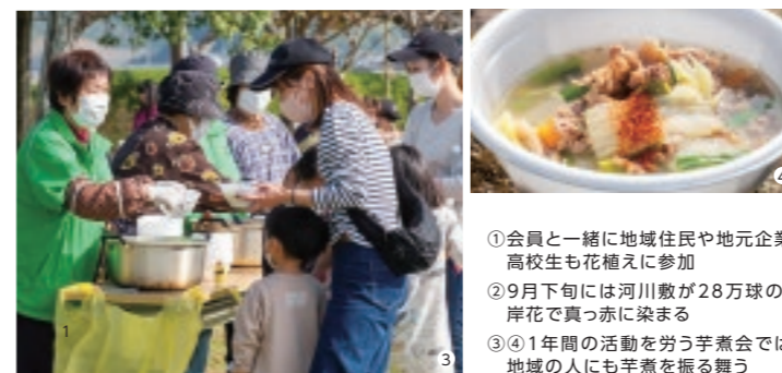
①会員と一緒に地域住民や地元企業、高校生も花植えに参加 ②9月下旬には河川敷が28万球の彼岸花で真っ赤に染まる ③④1年間の活動を労う芋煮会では、地域の人にも芋煮を振る舞う