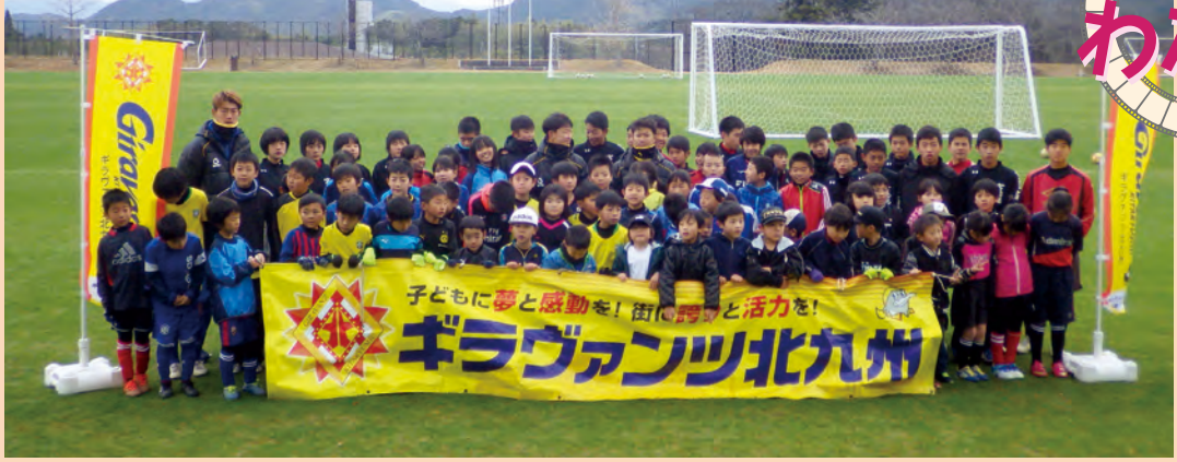
ギラヴァンツ小中学生サッカー教室