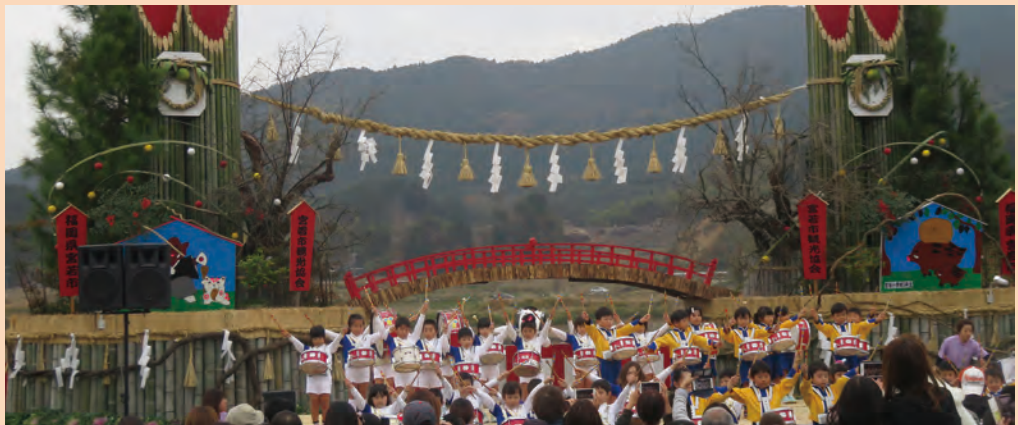
日本一の大門松祭