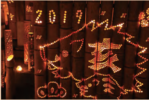
清水寺竹灯籠