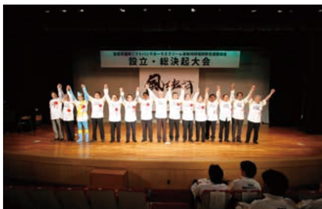
ソフトバンクホークスファーム本拠地球場誘致 期成会総決起大会

また、その他の市道は1,248路線で、整備については、地域の実情や自治会からの要望等を勘案しまして、年次的な整備に努めているところです。