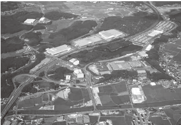
ソフトバンクファーム本拠地球場候補地

宮若市誕生より7年半が経過いたしました。平成24年度には、総合計画前期基本計画の最終年度を迎え、図書館、野球場、東中の完成により、前期基本計画で予定していた事業が概ね実現をしたと考えております。ここに来て、皆様とともに描いてきた新しいまちの姿がようやく見えて参りました。これもひ