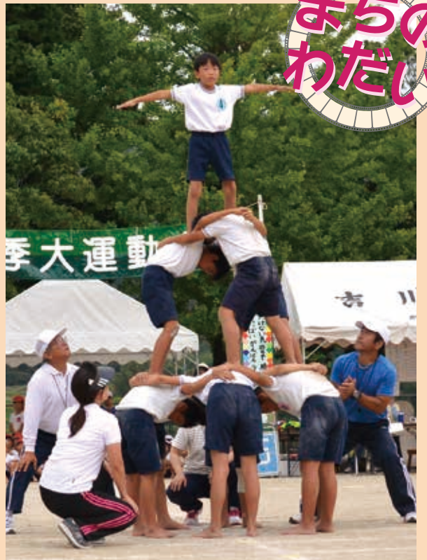
各小学校で運動会が行われました