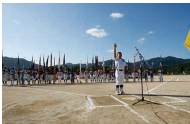
若宮ペガサス30周年記念