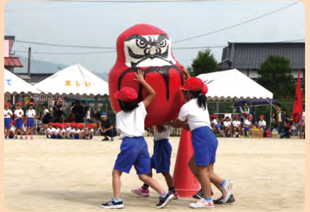
宮田東小学校運動会