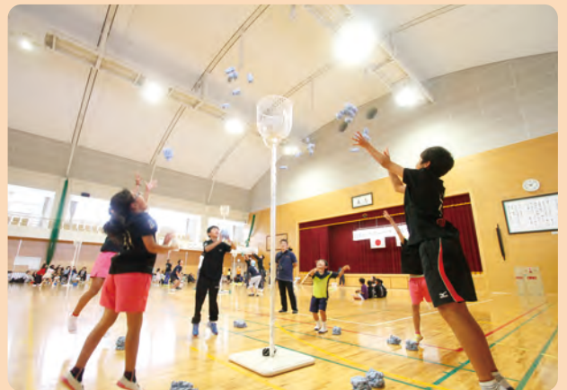
スポーツフェスタ2017