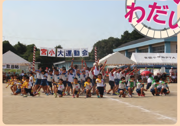
宮田小学校運動会