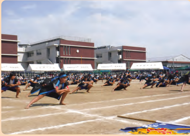
宮若西小学校運動会