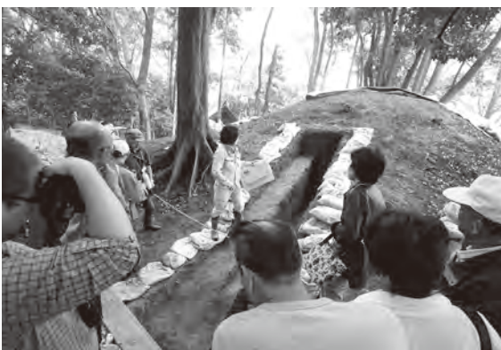
竹原古墳発掘調査現地説明会

平成29年3月定例会において議決を得た民事調停対象者5名は、4名が申立て前に納付されたため、残りの1名に對し、平成29年4月14日に直方簡易裁判所に民事調停の申立てを行ったところ、調停が成立しています。