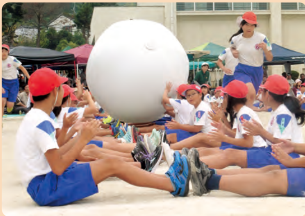
宮田北小学校運動会