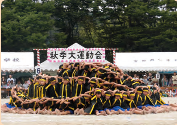
宮田南小学校運動会